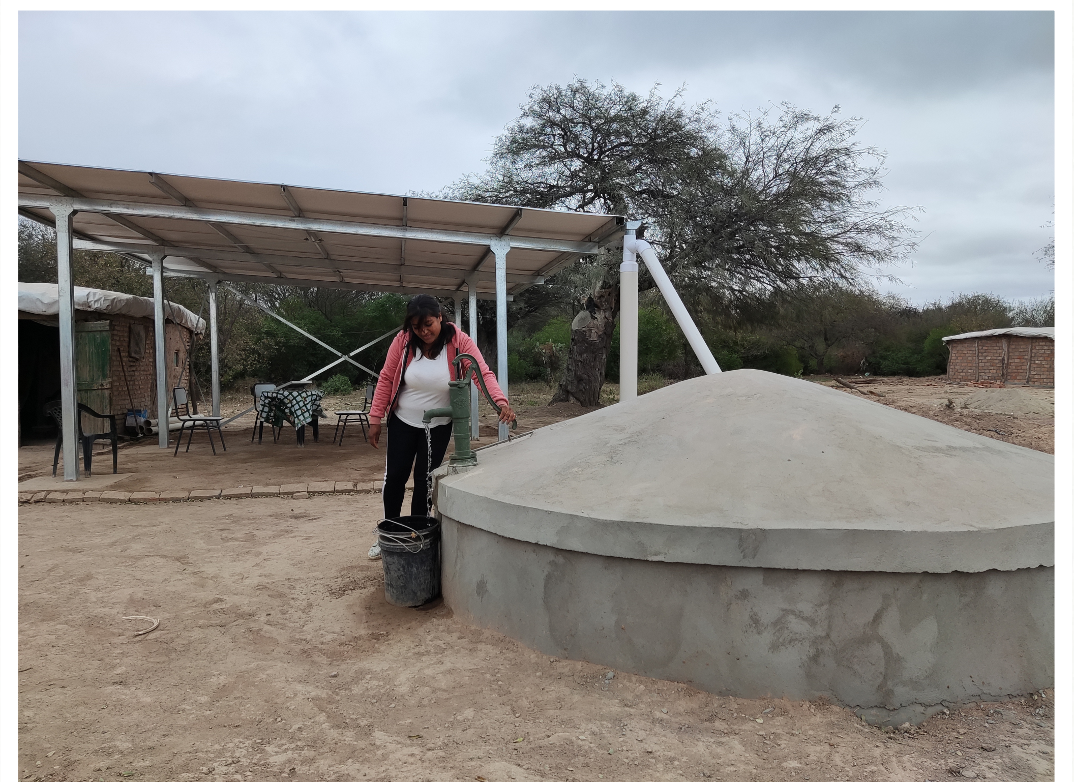
Sistemas de cosecha y almacenamiento de agua de lluvia: una solución que permite atravesar la sequía y la adaptación a la crisis climática.